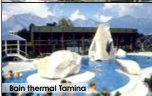
Bain thermal Tamina