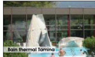
Bain thermal Tamina